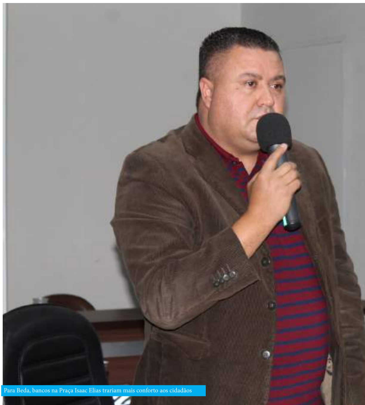
Para Beda, bancos na Praça Isaac Elias trariam mais conforto aos cidadãos

Revitalização, iluminação LED e colocação de bancos foram algumas medidas propostas durante a 24ª sessão ordinária