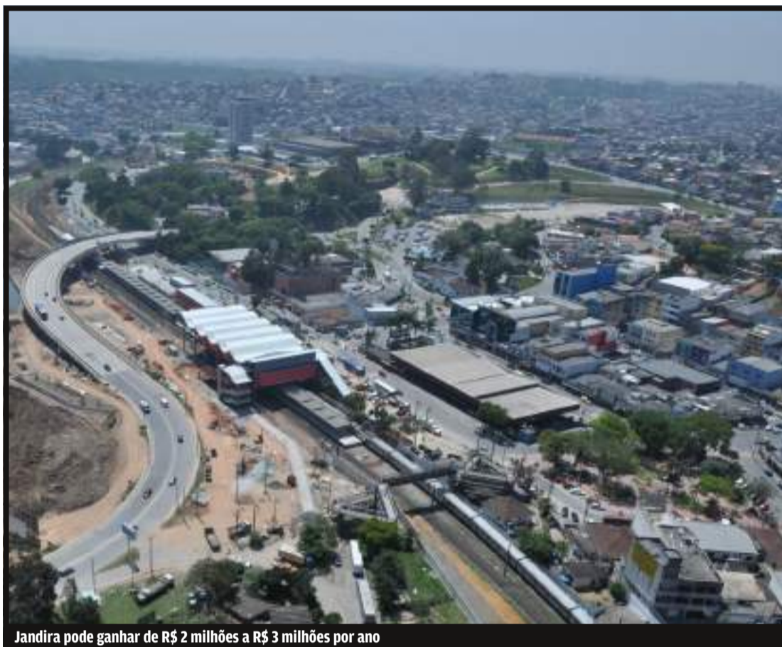
Jandira pode ganhar de R$ 2 milhões a R$ 3 milhões por ano

Projeto do prefeito adequou lista de serviços tributáveis pelo município, e foi aprovado depois da realização de duas audiências públicas