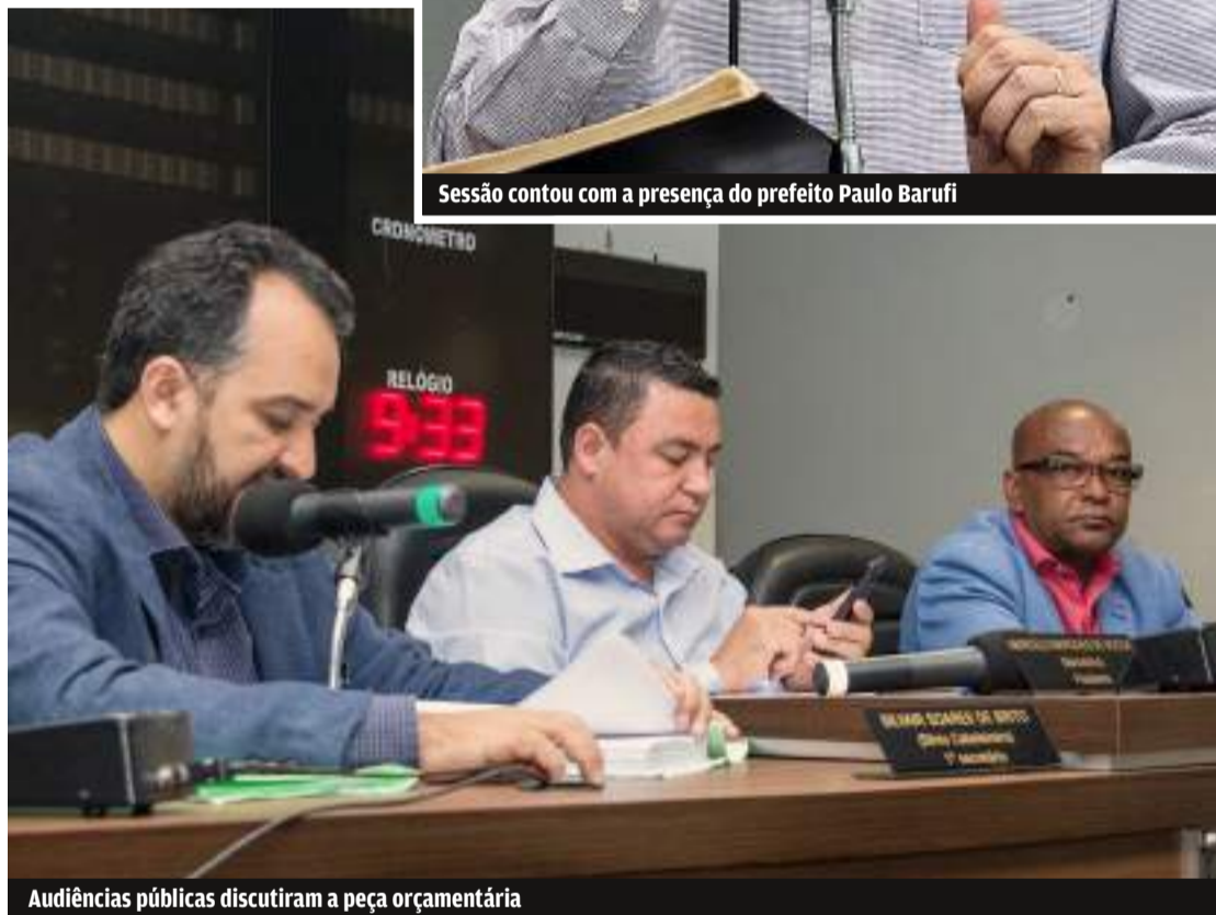
Audiências públicas discutiram a peça orçamentária