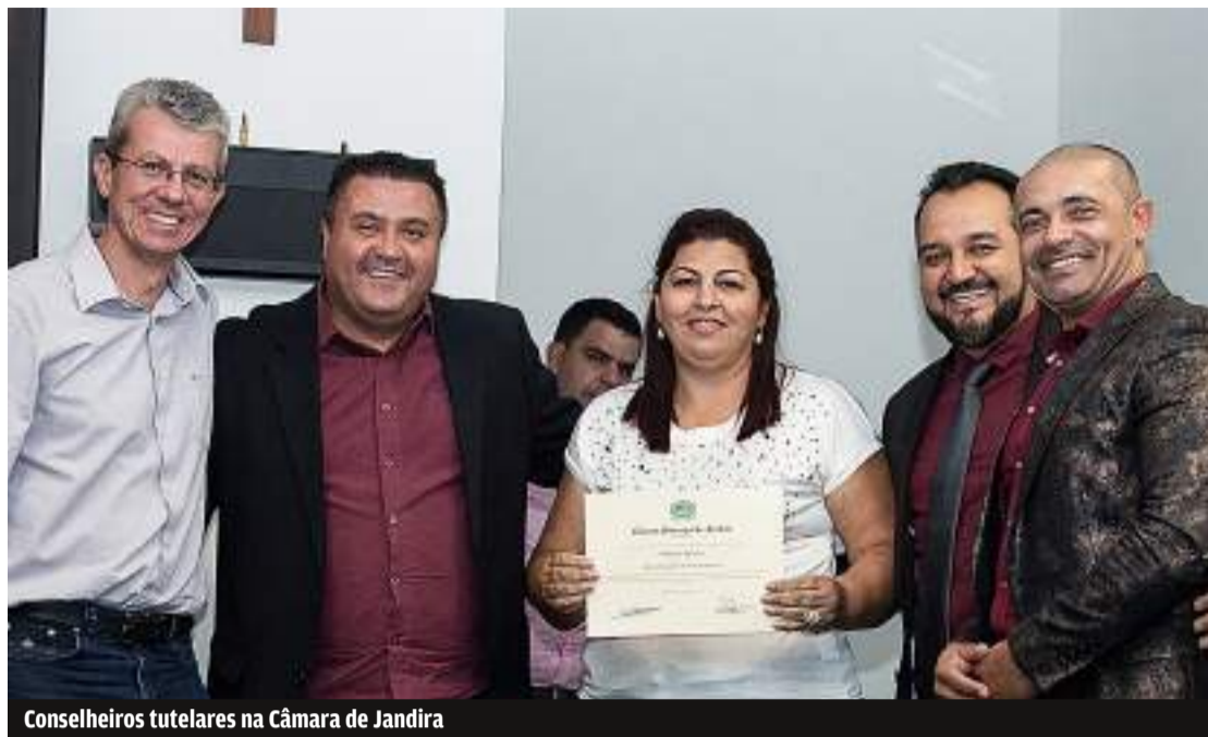
Conselheiros tutelares na Câmara de Jandira

O conselho tutelar é um órgão permanente e autônomo, eleito pela sociedade para zelar pelos direitos das crianças e dos adolescentes. Os conselheiros acompanham os menores em situação de risco e decidem em conjunto sobre qual medida de proteção para cada caso. O exercício efetivo da função de conselheiro constitui serviço público relevante e quem o