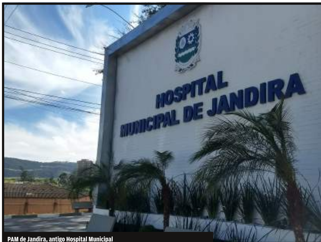
PAM de Jandira, antigo Hospital Municipal

A secretária informou ainda que o edital para contratar uma nova Organização Social (OS) para gerir o PAM deveria estar finalizado na última semana de agosto. “Esperamos que empresas sérias venham a se inscrever”, disse.